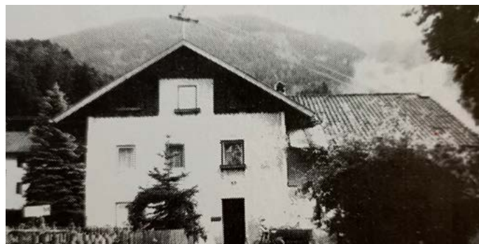
Das alte Mesnerhaus oberhalb des Widums, das 2000 abgerissen wurde