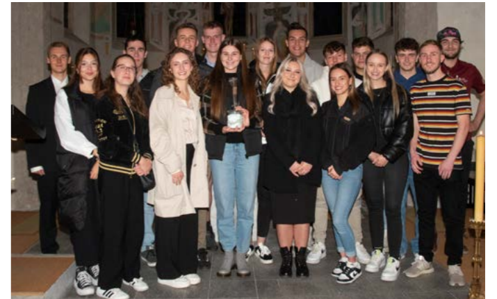
der Musikkapelle Hatting.