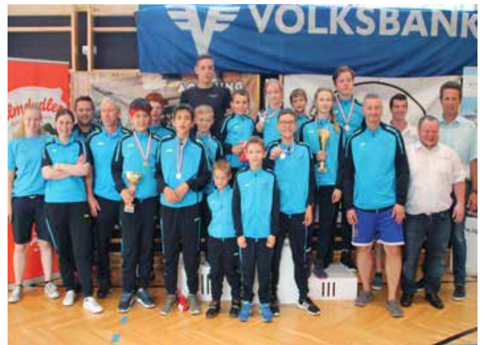
Mannschaft KSC Hatting