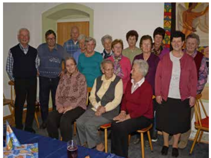
Hoangartstube im Pfarrsaal