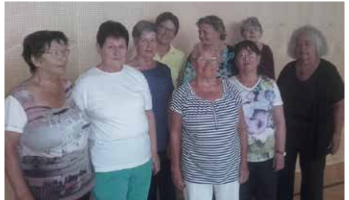
Weitere "bewegte" Damen herzlich willkommen!