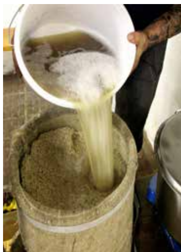
Läutern, also Trennen von fest und flüssig