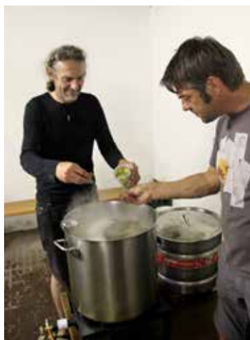
Mit dem Hopfen kommt die Würze