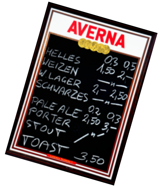
Eine große Auswahl an köstlichen Sorten – Ausschank nur an Mitglieder!

Natürlich kann man das „Hattiger Bier“ auch mit nach Hause nehmen – in der Flasche und für größere Feste auch im Fass. Wer es einmal getrunken hat, wird nicht mehr so schnell zum Industriebier greifen.